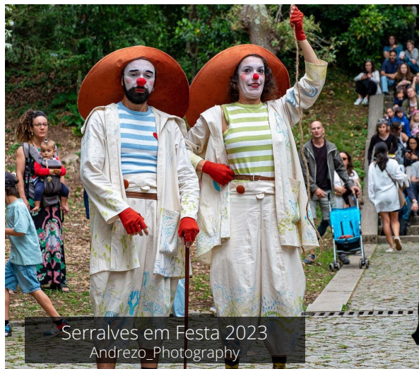
Serralves em Festa 2023