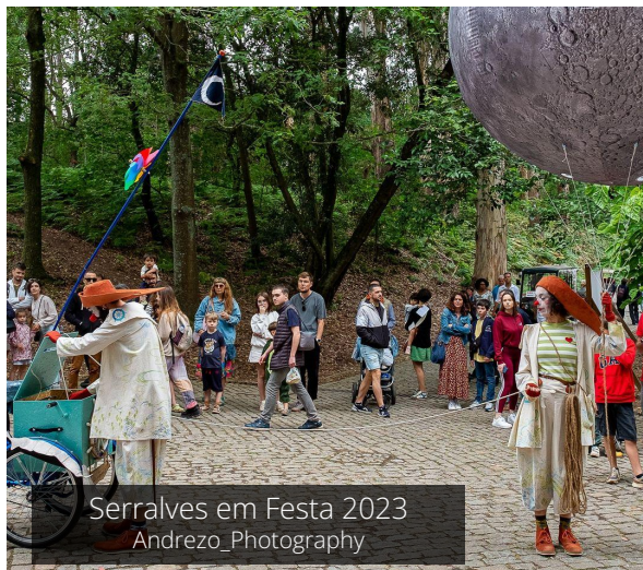
Serralves em Festa 2023