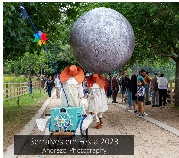
Serralves em Festa 2023 Andrezo_Phography